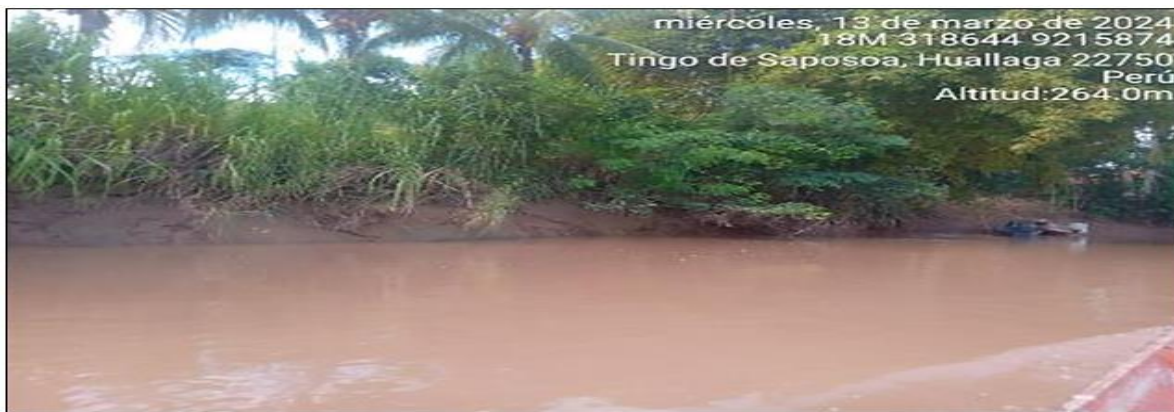
FIGURA N°03: TRAMO CRÍTICO EN EL RIO SAPOSOA POR DONDE SE DESBORDA EN TIEMPOS DE MAXIMAS AVENIDAS, GENERANDO INUNDACION DE LAS VIVIENDAS ALEDAÑAS AL CUACE DEL RIO.