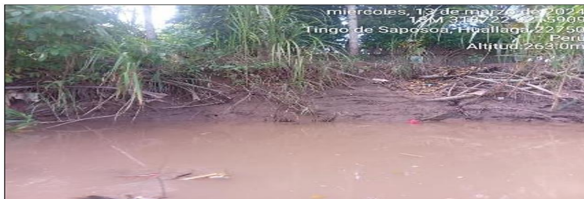
FIGURA N°02: TRAMO CRÍTICO EN EL RIO SAPOSOA, DONDE SE VISUALIZA LA EROSION EN EL TALUD DE LA RIBERA, GENERANDO DEBILITAMIENTO CON POSIBLE COLAPSO DE TALUD.