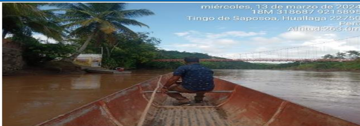
FIGURA N°01: TRAMO CRÍTICO EN EL RIO SAPOSOA, EN EL SECTOR TINGO DE SAPOSOA, DISTRITO TINGO DE SAPOSOA, PROVINCIA HUALLAGA - SAN MARTIN